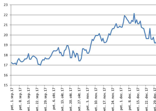
Indeks CEGHIX (v EUR/Mwh)

Indeks cene zemeljskega plina na avstrijski borzi CEGHIX se je v zadnjem četrletju lanskega leta gibal med 17,626 in 22,138 EUR/MWh. Cena je bila najnižja ravno v začetku četrletja in je rasla vse do sredine decembra. V zadnjem tednu decembra pa je indeks padel zaradi temperatur, višjih od povprečja za ta letni čas. Cene na glavnih trgovnih vozliščih v Evropi so se gibale ciklično in letnemu času primerno. Tudi statistično gledano so cene najvišje ravno v zimskem obdobju. Visoke cene indeksa lahko pričakujemo še v prvem četrletju leta 2018, seveda pa je to odvisno od povprečnih temperatur. K rasti cen so pripomogli tudi drugi trendi na energetske trgu. Najbolj pomembni faktorji so visoka rast cene premoga, nafte in emisijskih kuponov.